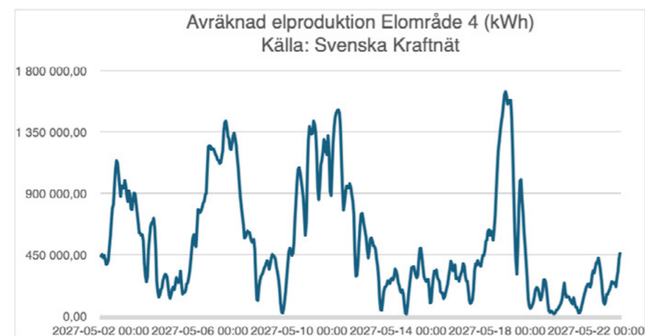
Tabell 3. Svenska Kraftnäts elproduktion vid närmaste mätstation under aktuell period

Som framgår av tabellerna är det stor överensstämmelse mellan vindstyrkor och fullaststoppar vilket sannolikt ger mest torn- och fundamentvibrationer i mark.